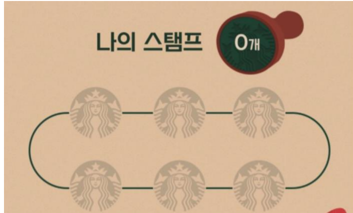
그림 3. 스탬프 인증 예시