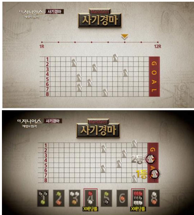
그림 1. 온라인 계주 예시

게임 진행 현황은 유튜브 스트리밍을 통해서 진행하며, 라운드 별 단서 제공은 카카오톡 또는 이메일을 통해서 제공할 예정입니다.