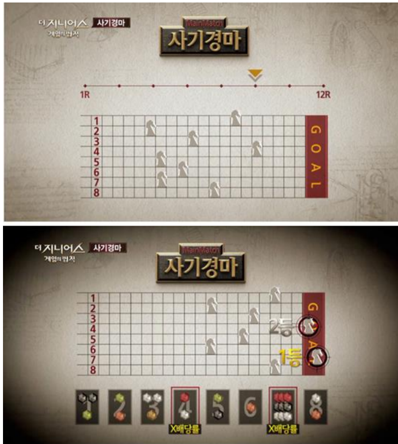
그림 1. 온라인 계주 예시

게임 진행 현황은 유튜브 스트리밍을 통해서 진행하며, 라운드 별 단서 제공은 카카오톡 또는 이메일을 통해서 제공할 예정입니다.