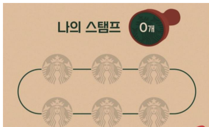
그림 3. 스탬프 인증 예시

2022 태울석림제 도장판을 만들어, 각 프로그램에 참여한 학생들에게 도장을 찍어줍니다. 대면 프로그램은 각 부스에서, 비대면 프로그램은 상품 수령 시 인포 부스에서 참여 인증을 확인할 예정이며, 도장판에 채운 도장 개수별로 축제 굿즈를 차등 지급할 예정입니다.